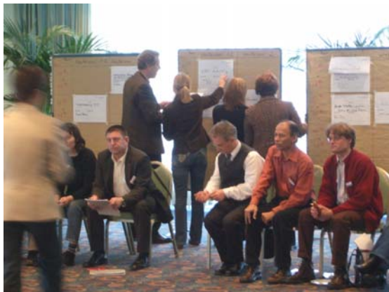
„Marktplatz“ der Themensammlung