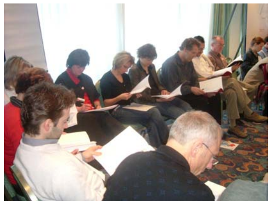
Lesen der Themendokumentation

Am Sonntagmorgen um 9 Uhr versammelten sich alle Mitarbeiter erneut. Nun hatten sie die Aufgabe, die am Samstag erarbeiteten Themen zu bewerten und 10 Kernthemen zu priorisieren. Hierzu gehörten zum Beispiel Nachhaltigkeit, Teamarbeit, Service oder Kommunikation. Nach Auswertung und Vorstellung der Hauptthemen ordnete sich jeder Mitarbeiter den Themen zu, die er in 2006 mit voran bringen möchte und für die er sich mit verantwortlich erklärt. Der eigentliche Teil einer Open Space