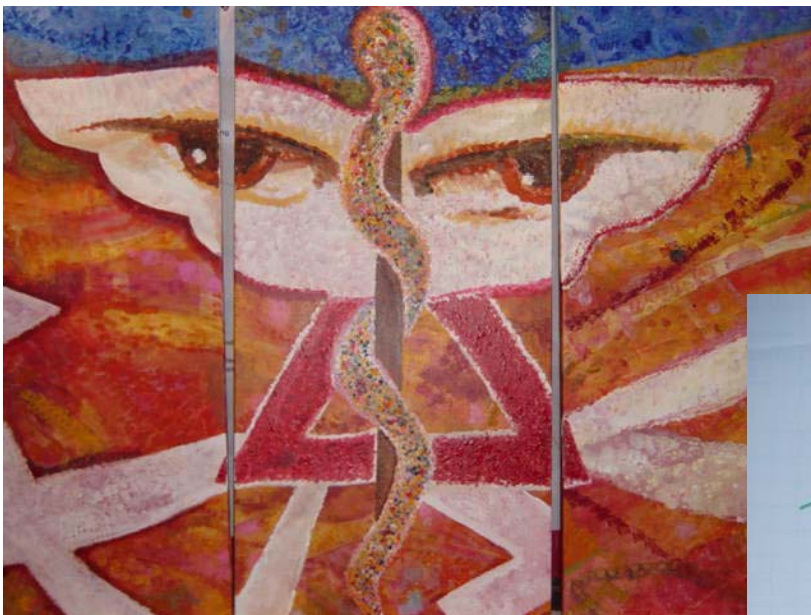
Das OCD-Gemälde nach der Fertigstellung

Es waren sich alle einig, „das war einen gelungene Abschlussaktion und es wird uns immer an die Jahreskonferenz mit seinen Zielen, Plänen, umzusetzenden Maßnahmen und den Spaß erinnern! Packen wir es an! Die Perspektiven 2006 warten!“.