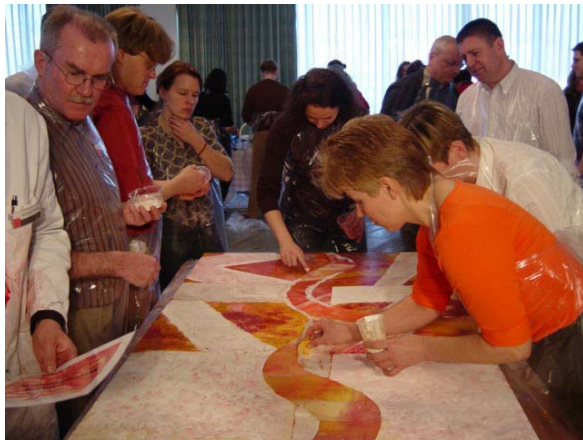
Das OCD-Gemälde wird gemalt

Es waren sich alle einig, „das war einen gelungene Abschlussaktion und es wird uns immer an die Jahreskonferenz mit seinen Zielen, Plänen, umzusetzenden Maßnahmen und den Spaß erinnern! Packen wir es an! Die Perspektiven 2006 warten!“.